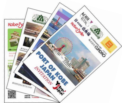
「神戸フードフェア in 上海小冊子